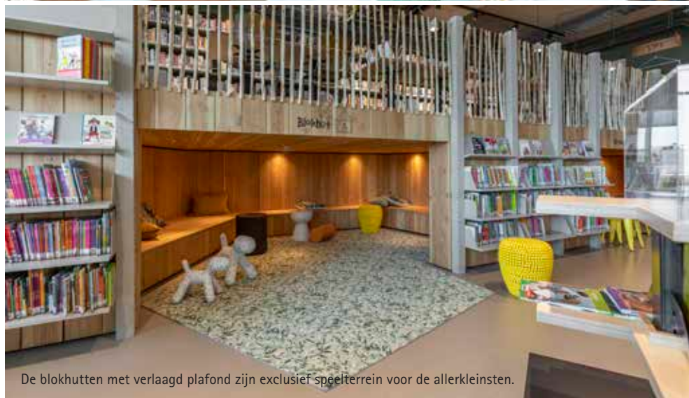
De blokhutten met verlaagd plafond zijn exclusief speelruimte voor de allerkleinsten.