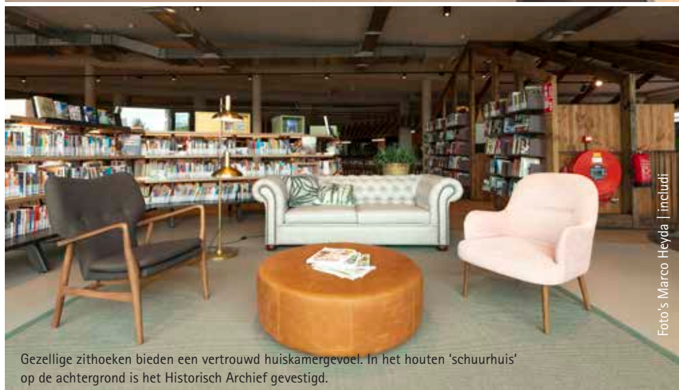
Gezellige zithoeken bieden een vertrouwd huiskamergevoel. In het houten ‘schuurhuis’ op de achtergrond is het Historisch Archief gevestigd.